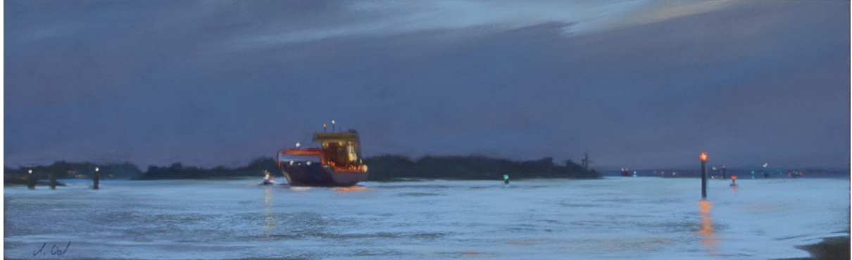
Nocturne - wenn es Nacht wird, 20×65 cm, Pastell, 2014

15. Oktober bis 29. November 2015 Reepschlägerhaus in Wedel bei Hamburg